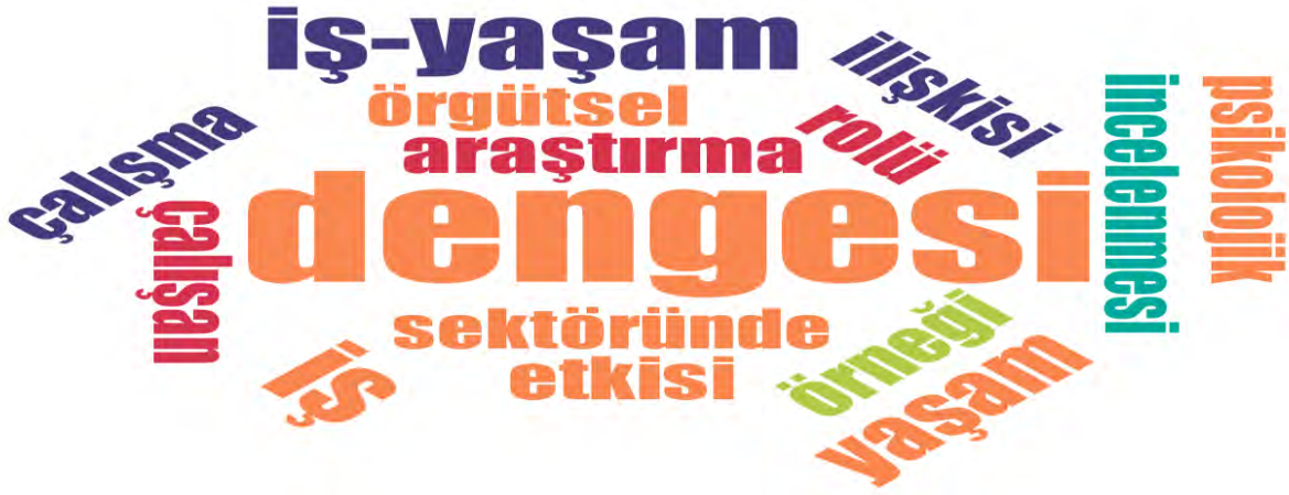
Şekil 1. Tez Başlıklarına Göre Kelime Frekansı

dengesi konusu ile ilişkilendirilen diğer kavram ve ana konular da ortaya konulmuştur. Tez başlıkları değişkeni baz alınarak yapılan kelime frekansı analizi aşağıda Şekil 1’de yer almaktadır.