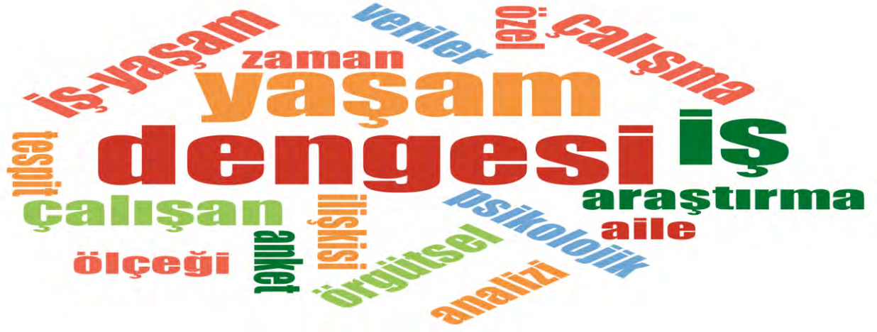
Şekil 3. Tez Özetleri Kelime Frekansları

Şekil 3’de tüm tezlerdeki özetler taranmış olup, kelime kökleri aynı olan kelimeler ekleri hariç tutularak birleştirilmiş ve 70 adet lisansüstü tezin, özetlerinde en sık rastlanan ilk üç kelime “dengesi (409 kere)”, “iş (392 kere)” ve “yaşam (383 kere)” olarak karşımıza çıkmaktadır. Ayrıca “çalışan (220 kere)”, “iş yaşam (207 kere)”, “çalışma (188 kere)”, “araştırma (157 kere)”, örgütsel (113 kere)”, zaman (74 kere)” ve “ölçeği (69 kere)” kelimeleri kullanılmıştır. Yine “veriler, aile, anket, ilişkisi, psikolojik, tespit, özel ve analizi” kelimelerinin de sık geçtiği görülmektedir.