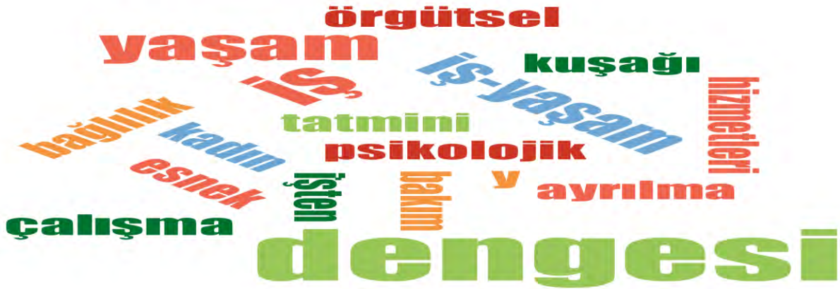
Şekil 2. Tezlerin Anahtar Kelimelerine Göre Kelime Frekansı

Kelimelerin kullanım sıklığından da anlaşıldığı üzere iş yaşam dengesi farklı sektörlerde çalışanlar ve farklı örneklemeler üzerinde ele alınırken, iş ve yaşam rolleri, örgütsel boyutu, farklı değişkenlerle ilişkisi ve etkileri üzerinde durulduğu görülmektedir.